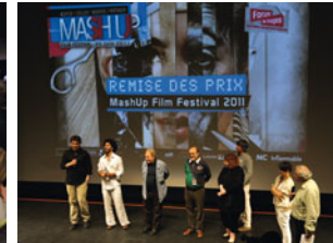
MashUp Film Festival