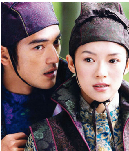
Le Secret des poignards volants de Zhang Yimou

Choisir un thème. Bâtir autour un programme qui met en résonance des œuvres très diverses. Établir des passerelles entre les films, les rapprocher, les opposer, les comparer. Inviter des cinéastes, des critiques, des sociologues, des historiens à en discuter. Et voilà comment se construit un cycle de films autour d'une thématique, l'une des spécialités fortes du Forum des images.