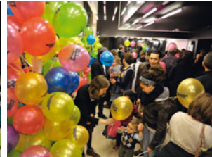
Tout-Petits cinéma