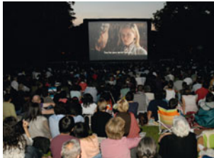
Cinéma au Clair de Lune

Toutes les formes, toutes les audaces, tous les pays, tous les thèmes... Les festivals et événements du Forum des images célèbrent l'image dans tous ses états. Avec une ambition singulière et toujours élargie : enchanter, surprendre, bouleverser, troubler... sans cesser de questionner le monde. À travers des œuvres, bien sûr, mais aussi des rencontres, des analyses, des débats.