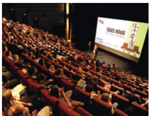
Salle 500 - Photo : © Nathalie Prébende

Entrée libre à la Salle des collections avec votre billet de cinéma ou à partir de 19h30 (pour deux heures).