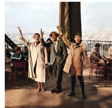
Drôle de frimousse de Stanley Donen