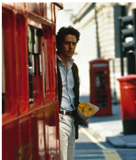
Coup de foudre à Notting Hill de Roger Michell