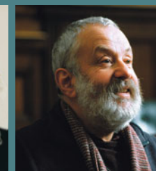
MIKE LEIGH en décembre 2011