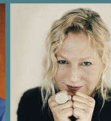
AGNÈS B. en novembre 2011