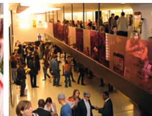
Hall d'accueil - Photo : © Nathalie Prébende