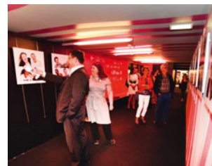
Exposition Lol Project