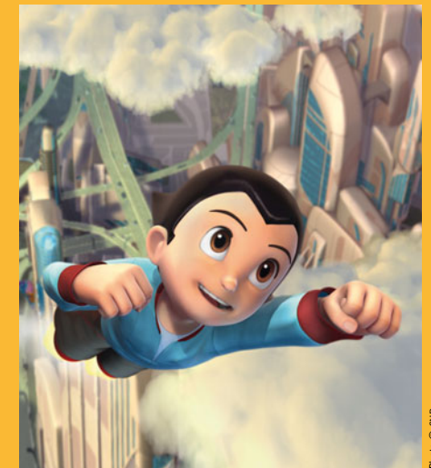
Astro Boy de David Bowers

Une caverne d'Ali Baba, à explorer en famille, avec plus de 150 films et plein de jeux multimédias sur le cinéma.