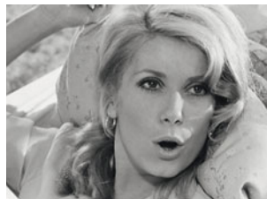
La Vie de château de J.P. Rappeneau