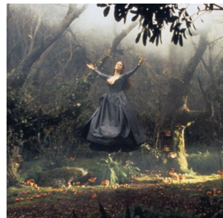
Sleepy Hollow de Tim Burton

Londres s'invite au Forum des images pour un portrait éclectique et cosmopolite. À l'écran, cité de cauchemar et de frisson des films noirs, capitale du swing au rythme des Stones et des Beatles avant de se laisser emporter par la vague punk, Londres nous est devenue familière dans les récits intimes d'un Mike Leigh, invité incontournable de ce cycle. Entre histoire et modernité, les cinéastes actuels filment une ville-monde, étonnante et bouillonnante.