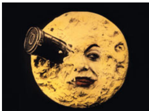
Le Voyage dans la lune de G. Méliès

Photos : Le Voyage dans la lune, De particulier à particulier © Collection Christophe, La Vie de château © D.R.